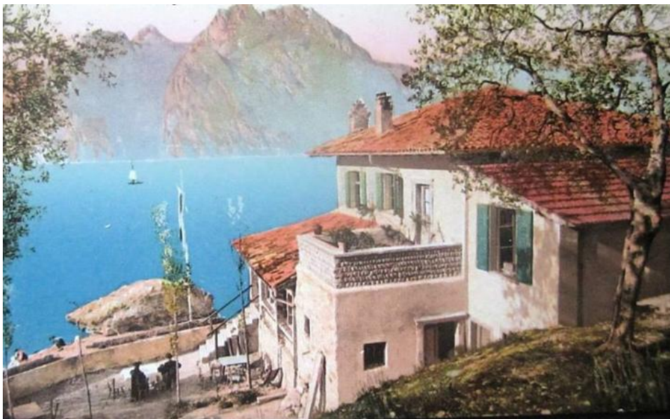
Il Caffè Ristorante Paradiso a Torbole

Ma fermiamo qui, per un attimo, questa storia affascinante, così da poter fornire ai lettori un doveroso chiarimento. Tutte i dipinti dei pittori di cui abbiamo parlato finora riportano uno strano e inquietante particolare al centro: un grande masso che sporge dalle acque del lago. Chi non l’avrà notato, ora si starà chiedendo - ancora più curioso