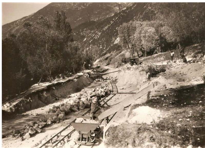
La costruzione della strada Gardesana Orientale

Lo strano nome era dovuto ad un altrettanto strano fenomeno naturale. Si racconta,