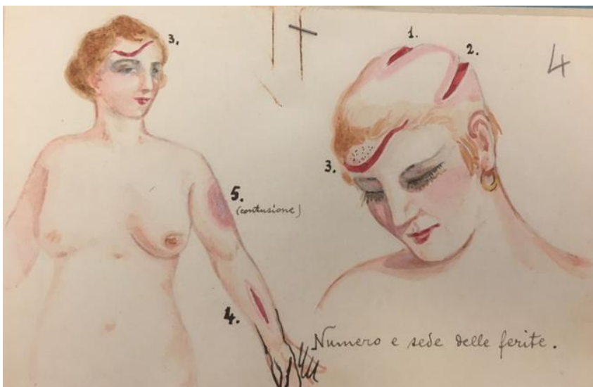
Lo schema disegnato a mano, con le ferite riportate dalla vittima.

Fra altre testimonianze, troviamo pure quella del medico comunale, dott. Enrico Less, il quale poche ore dopo il delitto dichiara ai carabinieri di "avere curato la donna e di averla trovata affetta da ferite da arma da punta e taglio nella parte superiore della testa, alla fronte e all'avambraccio sinistro, nonché affetta da commozione cerebrale e da forte anemia per il sangue perduto" . Di tutte queste ferite, verrà predisposto in accordo con i periti del tribunale uno schizzo dettagliato depositato agli atti.