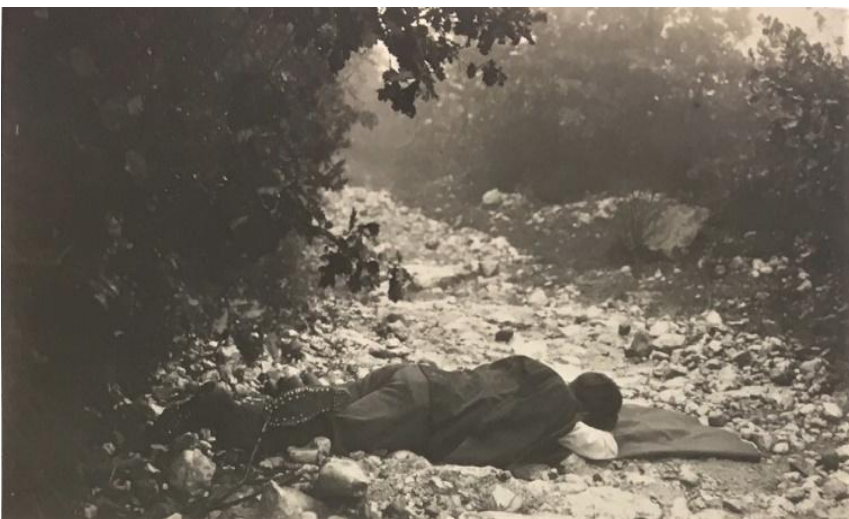
Nel dossier della Corte d'Assise di Trento, pure alcune fotografie che ricostruiscono con un figurante la scena del delitto.