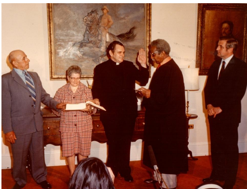
Mons. Baroni giura davanti al giudice della Corte Federale e al Vicepresidente Usa, Walter Mondale. A fianco i genitori di Geno.

Poco disposto ad accondiscendere al potere, qualche anno più tardi durante un discorso, dichiarerà pubblicamente: "E' una vergogna! In questo momento si stanno realizzando pochi alloggi popolari, meno della metà di quelli di cui abbiamo bisogno. Sappiamo quante case ci servono, perché quindi non le costruiamo?"