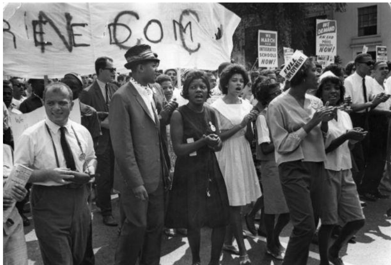
Una marcia per i diritti degli afro-americani

personali, umile e sempre dimesso anche nel vestire. Il merito di tanta popolarità derivava da un approccio e da un metodo - per certi versi rivoluzionario - che Baroni aveva testato direttamente sul campo e che lo portava spesso a dire: "Bisogna lasciare che i neri, e in genere ogni minoranza, vengano messi in condizione di dare prova di sé dimostrando di