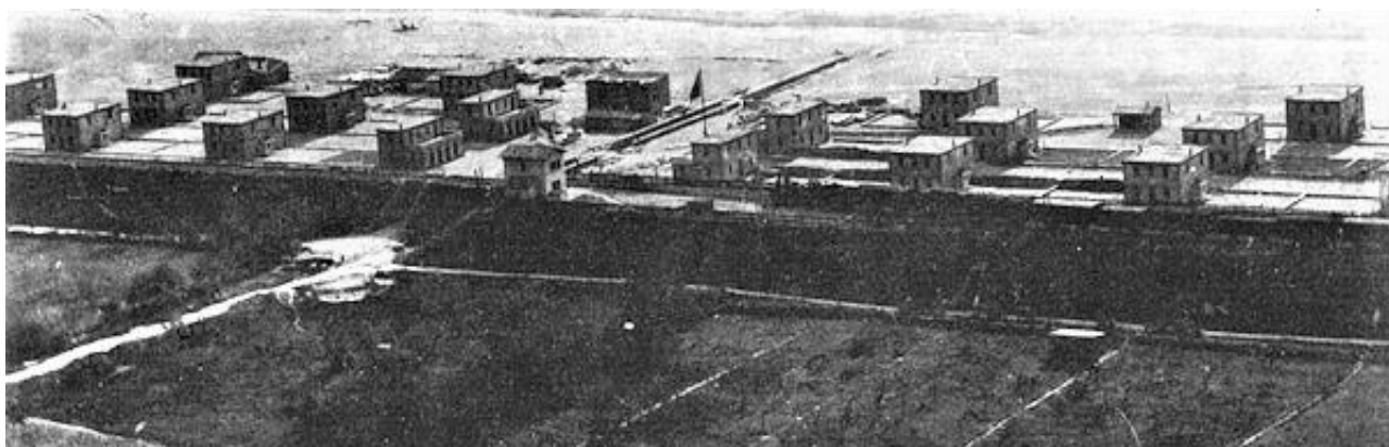
Una veduta dall’alto del nuovo Borgo: diciotto palazzine, una scuola, una chiesa, una piazza.