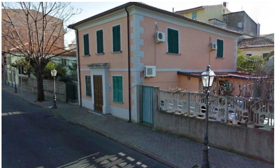
Una delle numerose palazzine ancora esistenti in Borgo San Marco e regolarmente abitate.

"L'Aurora" usciva con una notizia inaspettata: "La festa inaugurale, tanto attesa e tanto perseguitata dal fato, non avrà più luogo, ovvero si è già svolta a Roma in Montecitorio. Colà l'impresa costruttrice ha creduto convocare il Comitato esecutivo per consegnare alla sagace