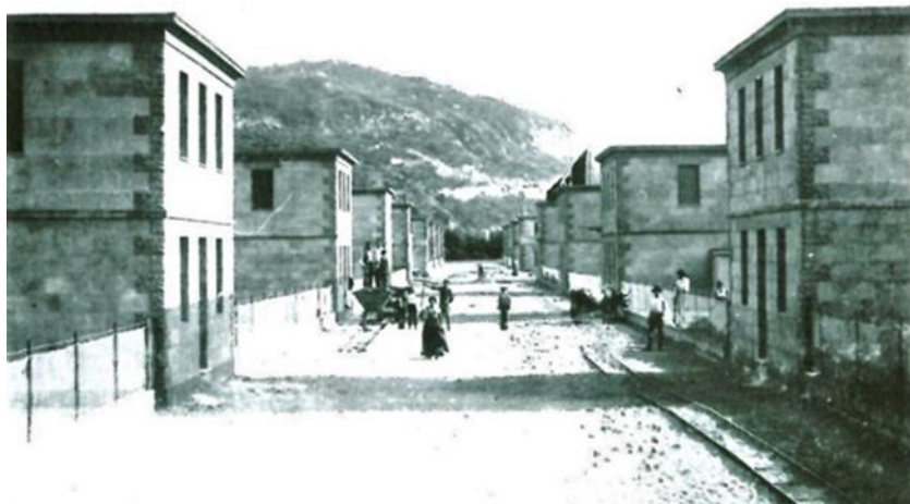
Il villaggio Veneto-Trentino quasi ultimato. A lato di ogni casa fu predisposto lo spazio per un piccolo orto familiare

Gli esiti della Commissione non potevano essere più disastrosi. Così si legge nei verbali: “L’inchiesta ha ben potuto accertare che in occasione del terremoto si è infranto il dovere civile dell’onestà e si è profanato il sentimento umano della carità” . Pure l’on. Luigi De Seta, che si era fatto da intermediario per la costruzione del Borgo Veneto Trentino, venne coinvolto nell’indagine in quanto il suo nome appariva più volte nei verbali della Commissione come uno di quelli che “in virtù dell’influenza politica esercitata aveva sperperato il denaro della beneficenza pubblica in favore degli abbienti” . A nulla, comunque, valsero le conclusioni della Commissione d’inchiesta la quale laconicamente testimoniò come nei lavori di ricostruzione “le baracche erano state la provvidenza per i poveri, mentre il restauro gratuito delle case la beneficenza per i ricchi” . Alla fine non se ne fece nulla. Il Presidente del Consiglio