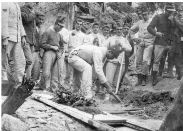
Gli aiuti arrivarono da tutta Italia e pure dall'estero

Eppure quel terremoto, pur nella sua tragica drammaticità, ebbe una nota positiva. Fu, infatti, la prima volta nella storia che i giornali italiani e stranieri scrissero in diretta, tramite i propri inviati, le cronache di quei giorni terribili dando il via ad una straordinaria gara di solidarietà.