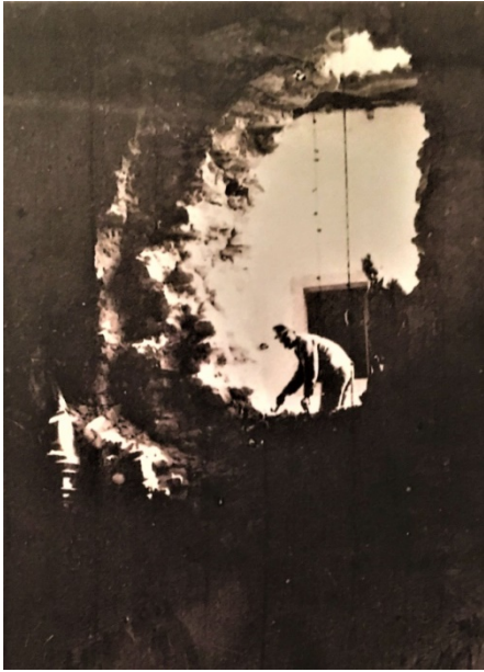
La breccia nel fianco destro della chiesa, causata da una granata italiana

luglio del 1916, non nel 1917. Pure il momento del decesso non è preciso in quanto la scritta riporta che la donna morì 4 ore dopo, quando, invece, le cronache del tempo affermano che la morte avvenne il giorno seguente.